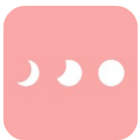
生理管理アプリ『ソフィ』のアイコン