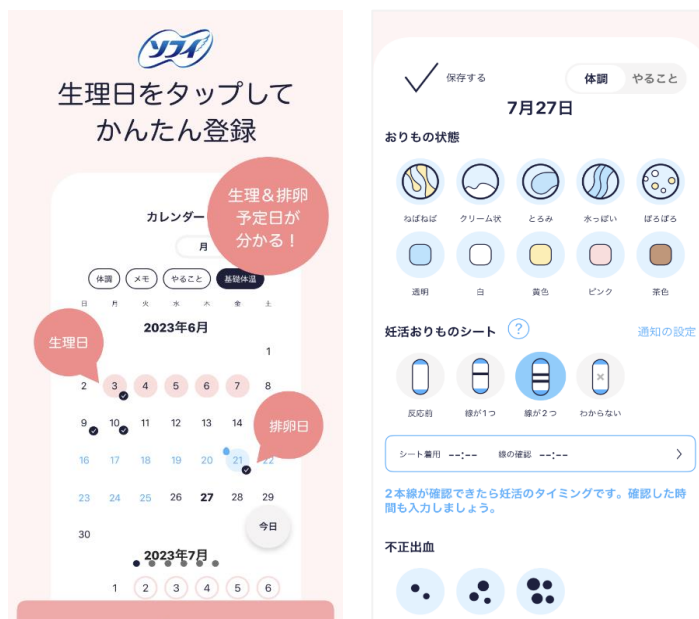
『ソフィ』妊娠希望モードのイメージ画面